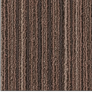
^ 880 50 x 50 cm