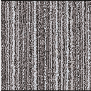
^ 900 50 x 50 cm