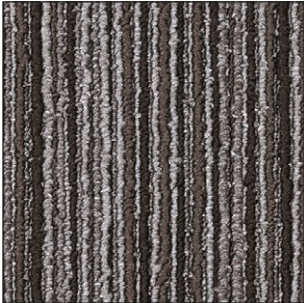
^ 980 50 x 50 cm